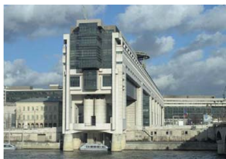
L'immeuble du ministère de l'Economie et des Finances à Bercy

La réunion pour la première fois le 11 janvier d'une conférence nationale spécifiquement dédiée aux finances publiques, témoigne d'une prise de conscience et d'une volonté d'assainir les comptes de la France que l'UPA n'a pas manqué de saluer. Dans l'intervention qu'il a prononcé à cette occasion, le Président Pierre Perrin a rappelé les deux priorités défendues par l'UPA en vue d'améliorer durablement les finances publiques : rationaliser les dépenses et réduire les prélèvements qui