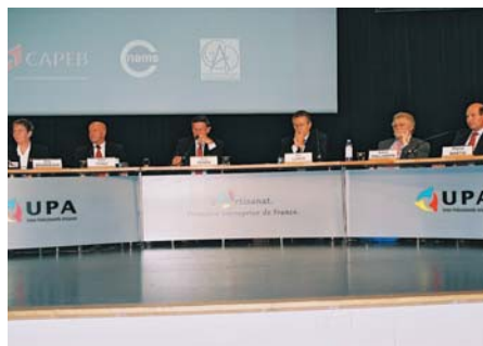
Parmi les sujets évoqués l'après-midi du 28 octobre : les élections aux chambres de métiers.

constitué des sections de l'UPA formées entre les représentations départementales et régionales des trois confédérations membres de l'UPA ; le rattachement de ces sections à l'UPA est entériné par le Conseil National qui peut également les révoquer". De fait, une procédure de labellisation a été décidée de façon à ce que les listes soient uniquement constituées de représentants des trois confédérations membres de l'UPA. Il s'agit en effet d'arriver à ces élections dans la clarté et la cohésion, et d'éviter par ailleurs d'éventuelles alliances contre nature, dont on sait qu'elles contribuent à terme à affaiblir le syndicalisme artisanal.