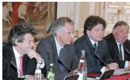
Dominique de Villepin entouré de Jean-Louis Borloo, Thierry Breton et Gérard Larcher

Entre les contrats nouvelles embauches, l'emploi des seniors et la nouvelle convention d'assurance-chômage, gouvernement et partenaires sociaux multiplient les initiatives pour doper l'emploi. Les CNE commencent à susciter l'adhésion des chefs de petites entreprises puisque plus de 10% de leurs recrutements se font en contrats nouvelles embauches. Tout en admettant la possibilité d'une marge d'erreur, l'Agence centrale des organismes de sécurité sociale -Acofs- a évalué à 74.000 le nombre de contrats CNE conclus en septembre, soit un total supérieur à 100.000 embauches depuis l'entrée en vigueur de la loi début août. Parallèlement les partenaires sociaux ont conclu un accord visant à