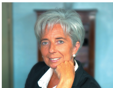
Christine Lagarde, ministre de l'Economie, des Finances et de l'Emploi

d'octobre. La ministre de l'Economie et de l'Emploi a écrit au Président de l'UPA en vue de préciser les thèmes qu'il conviendrait d'aborder (voir ci-contre). Sachant que les discussions devront s'articuler d'une part avec les négociations interprofessionnelles sur le marché du travail et la sécurisation des parcours professionnels et d'autre part avec l'accession de la France à la présidence de l'Union européenne au second semestre 2008, cette troisième conférence s'accompagnera d'un véritable "cycle de travail" selon les termes du courrier, qui devrait s'achever à la fin du premier semestre 2008. L'UPA pourra entrer dans le vif de ces sujets lors de sa rencontre avec la ministre le 12 septembre.