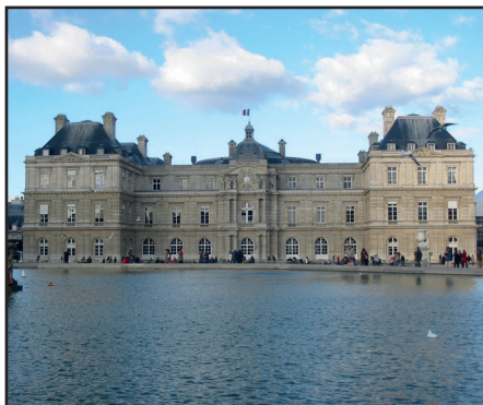
Le Palais du Luxembourg, siège du Sénat

des finances Jean Arthuis, a accédé à la demande de l'UPA de supprimer l'adjectif « individuelle » et ainsi de rétablir le bénéfice de la réduction aux entreprises artisanales exerçant en société. En adoptant cet amendement, les sénateurs ont veillé à maintenir la neutralité fiscale de cette réforme et l'égalité de traitement entre les artisans quelque soit la structure juridique de leur entreprise.