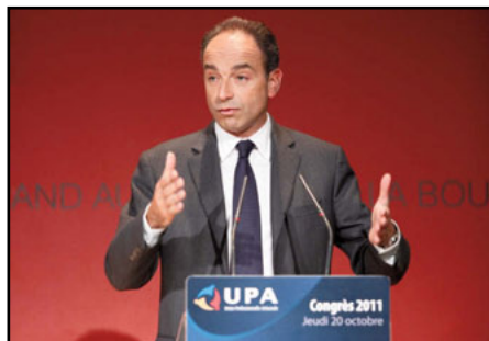
Allocution de Jean-François Copé, Secrétaire Général de l'UMP.

tendant à réguler davantage les relations entre donneurs d'ordre et sous-traitant serait prise en compte. Enfin, le président de la région Aquitaine et de l'Association des Régions de France a plaidé pour un reprofilage de l'impôt sur les sociétés au profit des petites entreprises. Le Secrétaire Général de l'UMP a quant à lui proposé de passer d'une durée légale du travail à des durées conventionnelles de travail négociées par les partenaires sociaux et a indiqué que sa formation souscrivait comme l'UPA à l'idée d'élargir l'assiette du financement de la protection sociale en allégeant les charges patronales et salariales. Le leader du parti majoritaire s'est par ailleurs prononcé pour un assouplissement des seuils sociaux de 11 et 50 salariés.