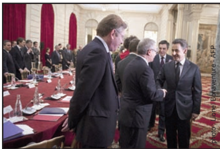
Le Président et le Secrétaire Général de l'UPA saluent le Président de la République lors du sommet de crise le 18 janvier 2012

Invité par le chef de l'Etat à participer avec l'ensemble des partenaires sociaux au sommet sur la crise à l'Elysée le 18 janvier, l'UPA a rappelé l'urgence d'une baisse drastique du coût du travail dans un contexte de crise, condition sine qua non du retour de la France dans le concert des nations compétitives. Ainsi, l'UPA a proposé au Président de la République deux actions prioritaires : baisser la contribution des revenus du travail au financement de la protection sociale et déverrouiller l'accès à l'emploi dans les petites entreprises. C'est pourquoi, à l'annonce des mesures arrêtées lors de l'allocution aux Français du Président de la République le 30 janvier, l'UPA s'est félicitée qu'une politique structurelle de réduction du coût du travail soit enfin engagée. L'UPA agit en effet dans ce sens depuis de nombreuses années en vue de favoriser l'emploi et la compétitivité des entreprises. Même si la baisse des charges sociales patronales n'entrera en vigueur qu'ultérieurement et de façon limitée, il s'agit d'un signe positif adressé aux chefs d'entreprise. L'UPA a été également rassurée par le maintien du taux réduit (5,5%) et du taux intermédiaire (7%) de TVA à leurs niveaux actuels ainsi que par la hausse mesurée du taux supé-