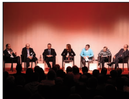
Le président de l'UPA et les responsables nationaux des cinq confédérations syndicales à la tribune.

Les opposants et détracteurs du dialogue social dans l'artisanat en seront pour leurs frais : la première réunion nationale des Commissions paritaires régionales interprofessionnelles de l'artisanat -CPRIA- s'est révélée de l'avis de tous (voir colonne ci-contre) un succès indéniable. Réunis dans une salle comble, 350 représentants syndicaux et patronaux ont su discuter dans un esprit constructif avec la volonté commune de faire avancer le dispositif. Organisée le 25 janvier aux salons de l'Aveyron à Paris, la manifestation a permis d'installer un débat entre les participants et les responsables nationaux de l'UPA et des cinq confédérations syndicales (CFDT, CFE-CGC, CFTC, CGT, CGT-FO). L'objectif de cette première rencontre était de dresser un premier bilan des CPRIA et d'échanger sur les bonnes pratiques. De fait, si aujourd'hui le maillage territorial est achevé puisque toutes les régions métropolitaines ont installé leur commission, il existe en pratique des états d'avancement très différents. Parmi les expériences innovantes, la CPRIA des Pays-de-la-Loire a présenté son dispositif